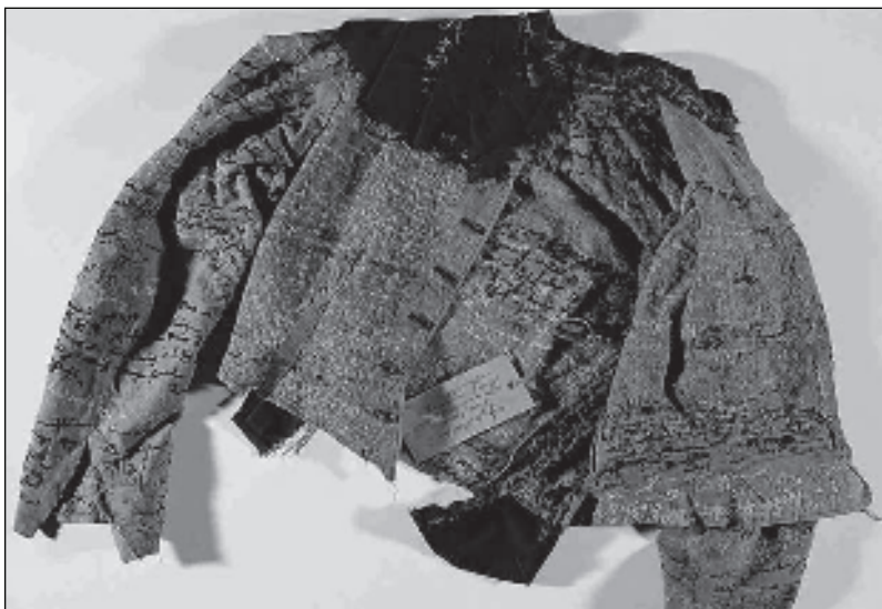
Gestichtsjasje van Anna Richter

tentoonstelling laat het kleine maar verrassende aandeel van vrouwen in de bekende Prinzhorncollectie zien.