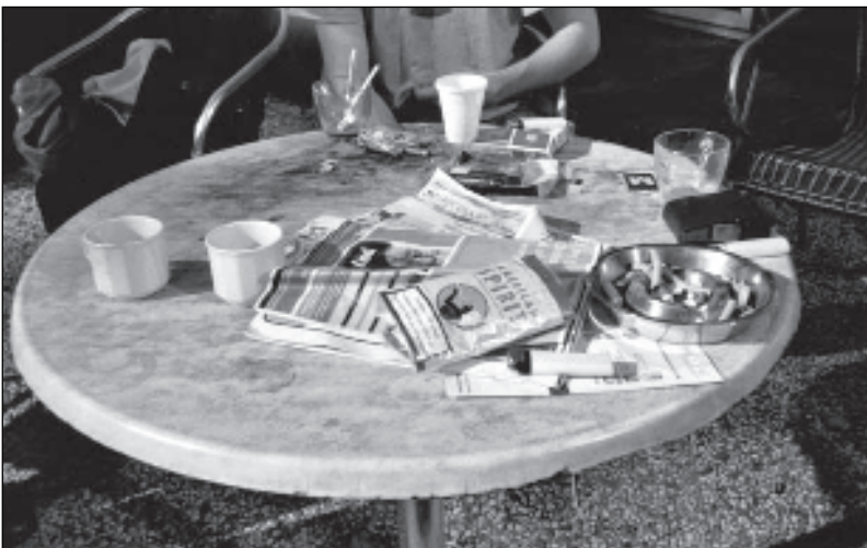
"De tafels worden altijd zo'n smerboel. Ik heb nog nooit zo'n tafeltje schoongemaakt, dus ik kan moeilijk zeggen dat iemand anders ervoor verantwoordelijk moet zijn. Maar ik maak de troep ook niet. Dit is typisch voor de psychiatrie, dat iedereen om zo'n tafeltje zit en dat ie viezer en viezer wordt en dat niemand zich er verantwoordelijk voor voelt. Niemand doet er iets aan."

woorden te beschrijven is? Neurologen beginnen dat raadsel langzamerhand te ontcijferen. Hieruit blijkt dat ons geheugen beelden, woorden en gebeurtenissen op heel verschillende plaatsen opslaat. Het is als een harde schijf van de computer die herinneringen als fragmenten en flarden opslaat. Een gebeurtenis, ervaring of beleving komt pas weer tot leven als de fragmenten tot een geheel gesmeed worden. Zo zit ons denken en ons gebruik van de taal in een ander deel van de hersenen dan beelden en gevoelens. Een foto is een hulpmiddel om denken en voelen bij elkaar te brengen.