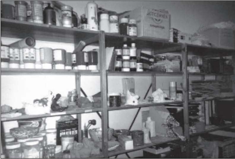
"De kunstruimte. Omdat ik van kunst hou."